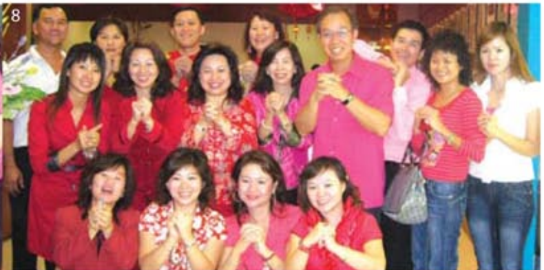
8. “恭喜发财，红包一个一个来!”